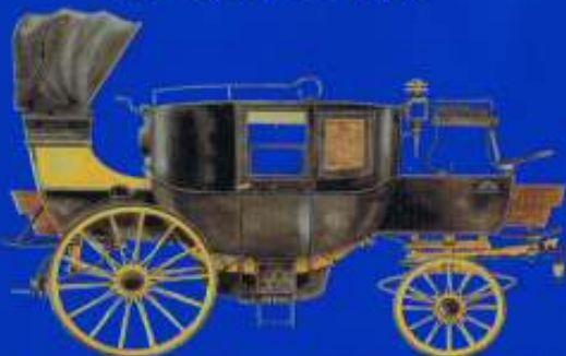
Berline de voyage d'Eugène Schneider, fondateur du Creusot - 1840.

tué par les Zoulous en Afrique australe à l'âge de 23 ans.